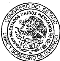
DIP. ADRIAN VALLES MARTÍNEZ PRESIDENTE.

Dado en el Salón de Sesiones del Honorable Congreso del Estado, en Victoria de Durango, Dgo., a los (22) veintidos días del mes de enero del año (2013) dos mil trece.